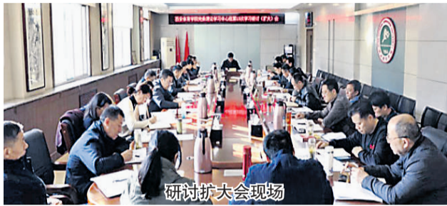
研讨扩大会议现场